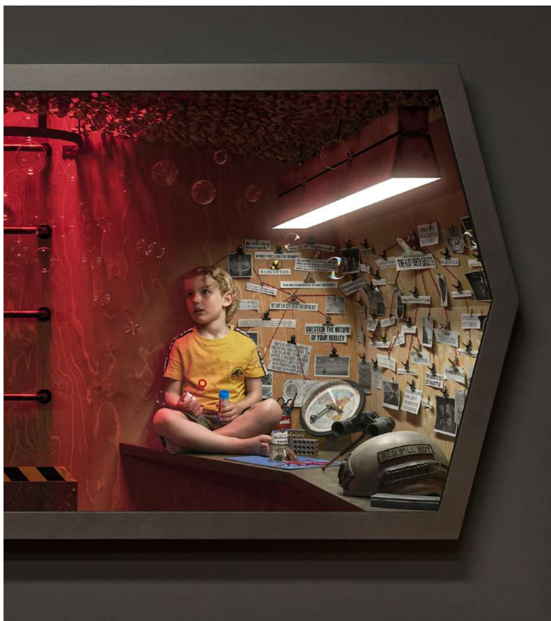
© Dirk Hardy, Vivarium Episode 11, Echo Chamber, 2023